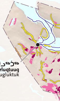
የክፍለ-የቀበሌ አጠቃላይ መግቢያ Qurluqtuuq Kugluktuk